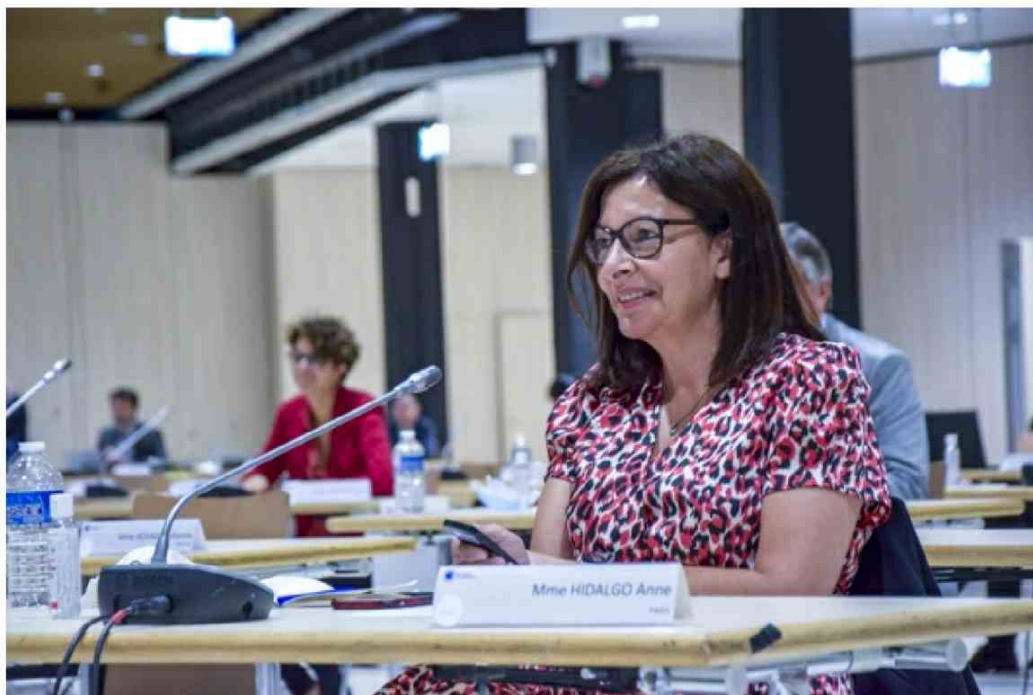
Anne Hidalgo.