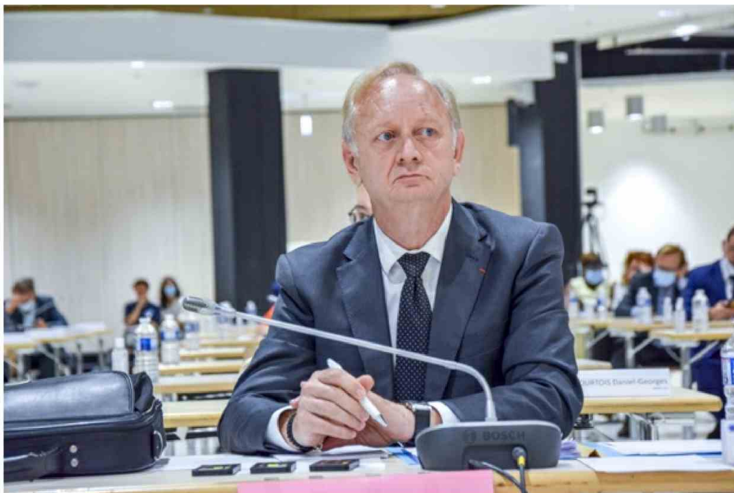
Eric Cesari © Jgp