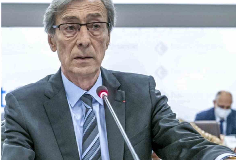
Georges Siffredi