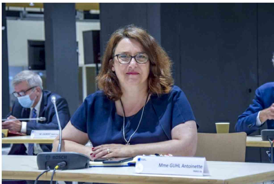
Antoinette Guhl.