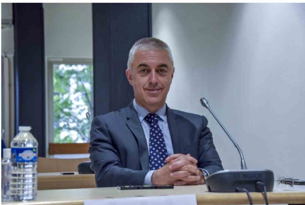
Manuel Aeschlimann