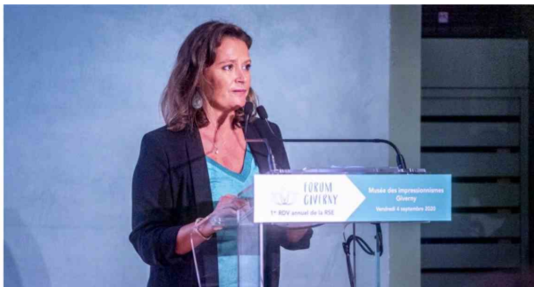
Olivia Grégoire, secrétaire d'Etat chargée de l'Economie sociale, solidaire et responsable.