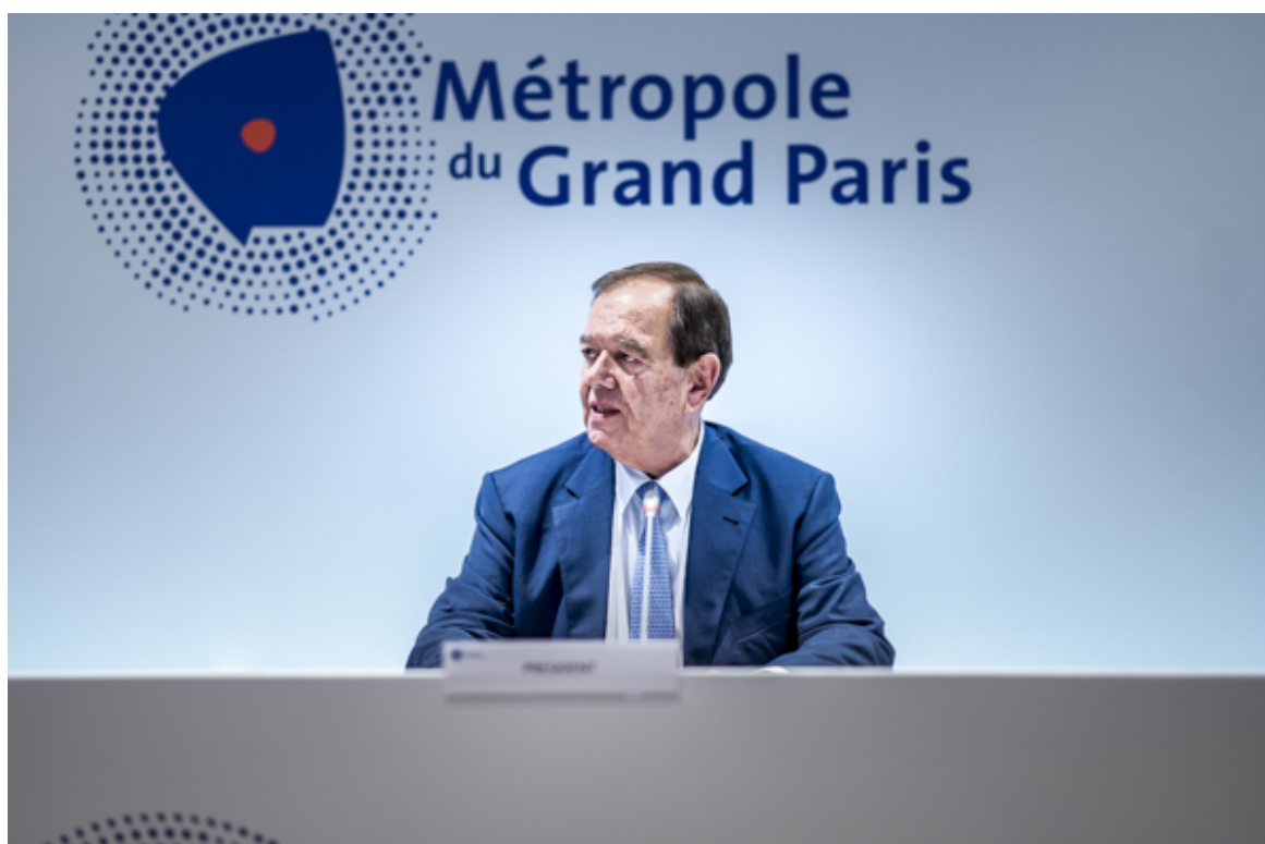
Patrick Ollier, président de la métropole du Grand Paris.

La métropole du Grand Paris souhaite inclure les citoyens dans ses réflexions. A cette fin, elle lance une série de débats citoyens, en visio. « Ces débats seront l'occasion, pour les habitants et usagers, de prendre part aux concertations et de voir l'impact concret des politiques métropolitaines sur leur quotidien », souligne la Métropole.