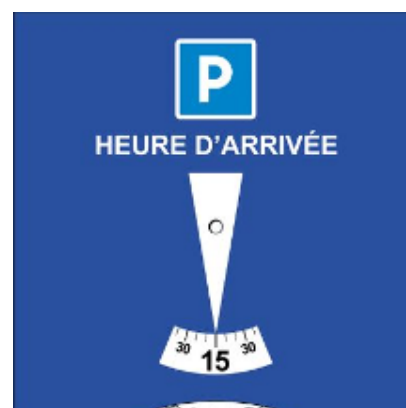
FIGURE 10 : EXEMPLE DE DISQUE EUROPEEN | JONCTION, 2019

Pour faciliter le contrôle des réglementations, des outils existent et peuvent être utilisés plus ou moins aisément. Les communes peuvent imposer l'utilisation d'un disque horaire pour les véhicules s'arrêtant sur les aires de livraison. Ce dispositif permet de limiter le temps d'arrêt des véhicules et ainsi d'accroître le taux de rotation sur ces aires mais aussi et surtout de faciliter le contrôle par les agents. Un véhicule s'arrêtant sur une aire de livraison renseigne son heure d'arrivée. Les agents de contrôle peuvent ainsi savoir si le véhicule a dépassé le temps qui lui est imparti ou non. Peu coûteuse et relativement facile à mettre en place, cette action apporte des résultats probants (tout au moins pour le contrôle des véhicules).