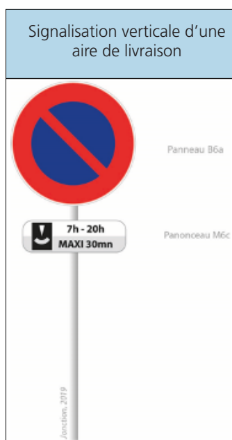
FIGURE 7 : SIGNALISATION DE LA RÉGLEMENTATION DU STATIONNEMENT | JONCTION, 2019

La signalisation verticale ne mentionne pas l'acte de livraison. Ce dernier l'est par le biais du marquage au sol.