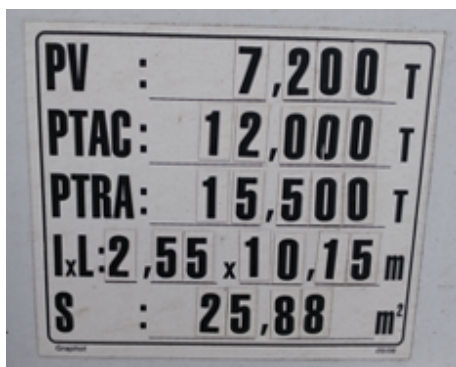
FIGURE 9 : EXEMPLE DE PLAQUE DE TARE | JONCTION, 2019

Depuis peu, les véhicules utilitaires légers récents ne disposent plus systématiquement de cette plaque de tare.