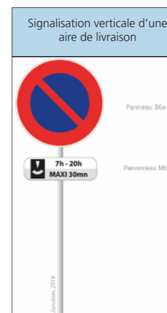
FIGURE 7 : SIGNALISATION DE LA REGLEMENTATION DU STATIONNEMENT | JONCTION, 2019

La signalisation verticale ne mentionne pas l'acte de livraison. Ce dernier l'est par le biais du marquage au sol.