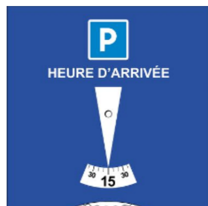
FIGURE 10 : EXEMPLE DE DISQUE EUROPEEN | JONCTION, 2019

Pour faciliter le contrôle des réglementations, des outils existent et peuvent être utilisés plus ou moins aisément. Les communes peuvent imposer l'utilisation d'un disque horaire pour les véhicules s'arrêtant sur les aires de livraison. Ce dispositif permet de limiter le temps d'arrêt des véhicules et ainsi d'accroître le taux de rotation sur ces aires mais aussi et surtout de faciliter le contrôle par les agents. Un véhicule s'arrêtant sur une aire de livraison renseigne son heure d'arrivée. Les agents de contrôle peuvent ainsi savoir si le véhicule a dépassé le temps qui lui est imparti ou non. Peu coûteuse et relativement facile à mettre en place, cette action apporte des résultats probants (tout au moins pour le contrôle des véhicules).