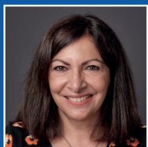
Anne HIDALGO (Paris) Vice-présidente déléguée aux Relations Internationales et aux Grands Événements