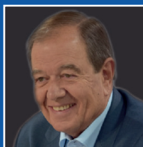
Patrick OLLIER Maire de Rueil-Malmaison